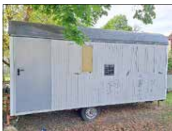
Bauwagen 5,00 m x 2,10 m / ohne Zulassung

Die Gemeinde Märkische ist nicht verpflichtet, dem höchsten oder irgendeinem Gebot den Zuschlag zu erteilen.