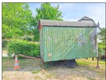
Bauwagen 2,35 m x 1,25 m 2 / ohne Zulassung / stark sanie- rungsbedürftig